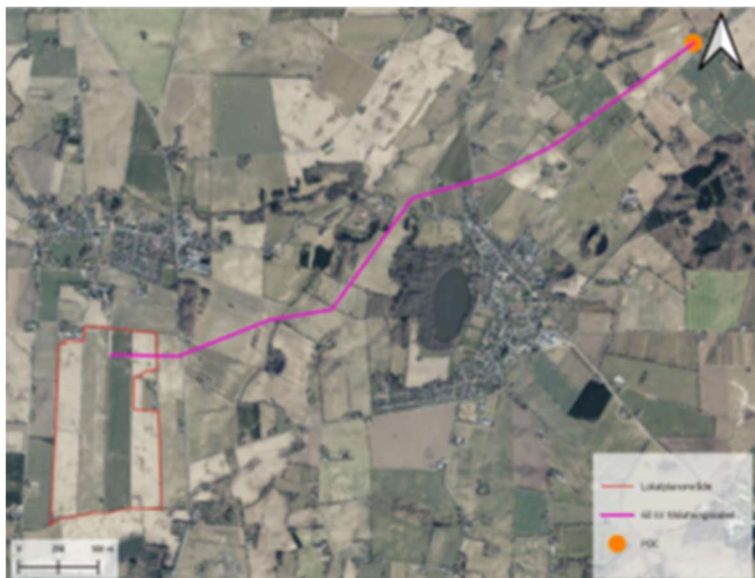
Figur 2. Kort over forventet kabeltracée til nettilslutningspunkt.

Solcelleparken formodes at blive tilkoblet elnettet ved station Hesselager, beliggende ca. 3,5 km nordøst for projektområdet (Figur 2). Tracéet indgår i miljøvurderingen under forudsætning af, at Energinets elnet forstærkes inden flere projekter kan tilsluttes. Elnetselskabet afgør hvilket spændingsniveau solcelleparken forbindes til elnettet på, og der forventes behov for en 60 kV transformer opstillet på projektområdet.